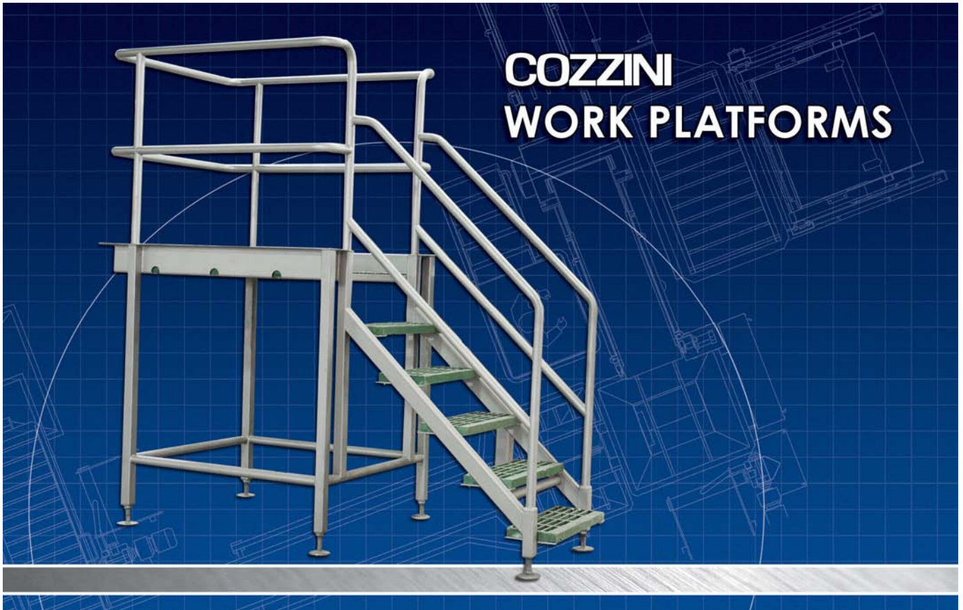
PLATE-FORME DE TRAVAIL