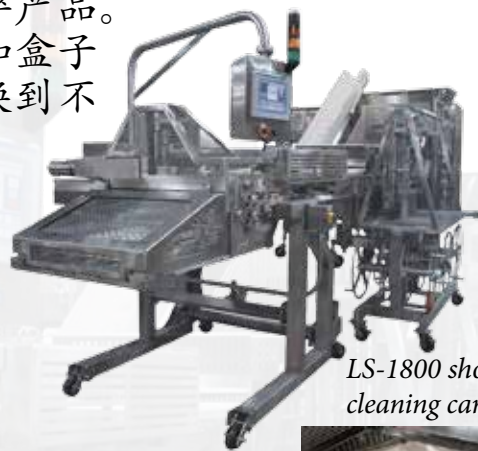
LS-1800 shown with cleaning cart option.